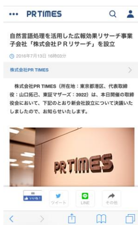
PR TIMES スマートフォン版 シェアボタン「その他」展開前後の画面

前述のビジネスチャットアプリを利用中のユーザーはより手軽でタイムリーに、自社プレスリリースや競合他社プレスリリースなどを特定のグループへ情報共有することができます。