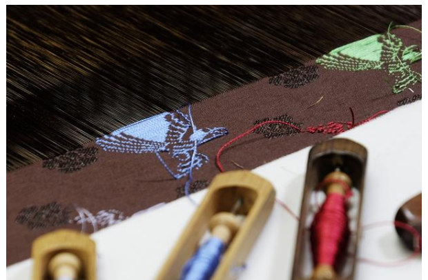
京都の伝統産業からベンチャー企業まで、まだ全国に知られていない魅力を発信するPR支援

さらに、実際にプレスリリース配信の効果を体感いただく機会として、京都銀行の法人顧客に対して、6ヶ月間に3回無料でリリース配信できる「京都銀行特別プラン」を提供いたします。